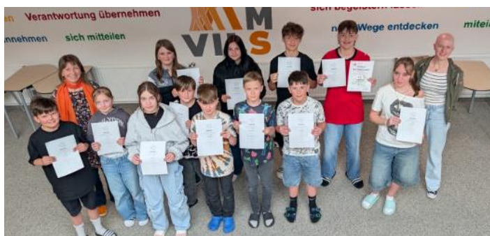
Die Klassensieger der MS Vils beim Känguru der Mathematik